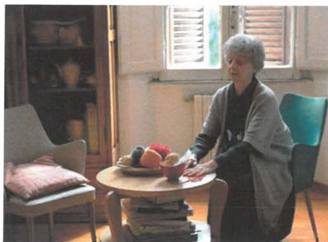
Un momento delle riprese.